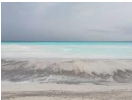
le spiagge bianche di Rosignano