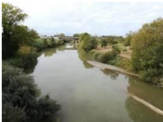
vicino alla foce il fiume riprende acqua