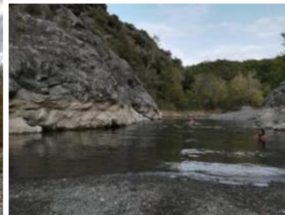
Masso degli specchi

Ma lo stesso fiume è oggetto da anni di un iper-sfruttamento da parte della multinazionale Solvay (titolare di concessione) che preleva una grande quantità di acqua nel tratto mediano del fiume per trasportare la salgemma agli stabilimenti industriali di Rosignano a circa 25 km di distanza per produrre principalmente bicarbonato. Oltre ad avere impatti sull'ecosistema fluviale causati dall'enorme prelievo d'acqua che non tiene conto del decorso minimo vitale (cioè la minima quantità d'acqua che serve per garantire la continuità della vita fluviale) quest'attività industriale provoca con lo scarico a mare dei residui di produzione (sale, gesso, sabbia e argilla e metalli pesanti come mercurio, arsenico, cadmio, cromo e piombo) il decoloramento delle spiagge che assumono un innaturale colore bianco (le acque diventano turchesi) tanto che le spiagge bianche vengono soprannominate "maldives italiane" e stando alla UNEP (United Nations Environment Programme) è tra le 15 spiagge costiere più inquinate del Mediterraneo.