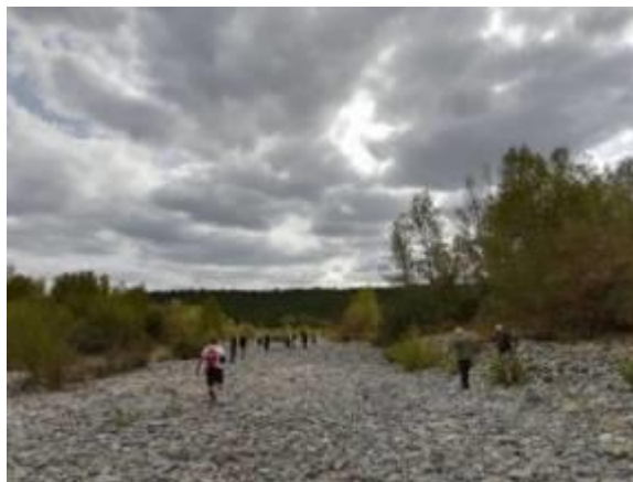
il letto in secca del fiume