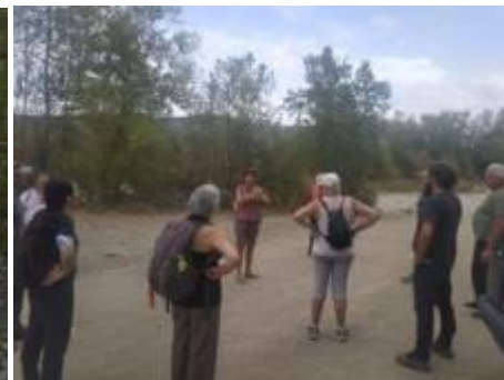
escursione sul fiume Cecina

GIAN Sez. Gran Pino - Via Guerrazzi, 110 - 57023 Cecina (LI)