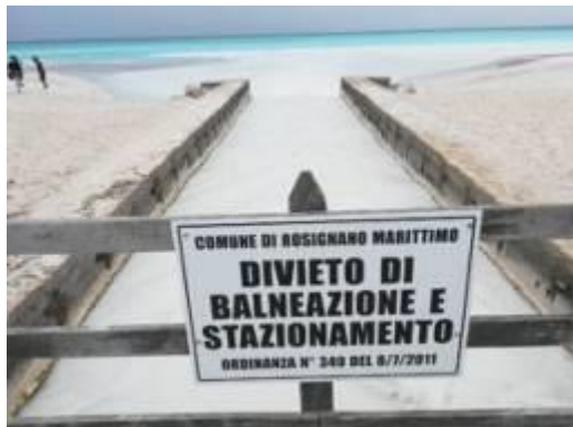
le spiagge bianche di Rosignano

Ma lo stesso fiume è oggetto da anni di un iper-sfruttamento da parte della multinazionale Solvay (titolare di concessione) che preleva una grande quantità di acqua nel tratto mediano del fiume per trasportare la salgemma agli stabilimenti industriali di Rosignano a circa 25 km di distanza per produrre principalmente bicarbonato. Oltre ad avere impatti sull'ecosistema fluviale causati dall'enorme prelievo d'acqua che non tiene conto del decorso minimo vitale (cioè la minima quantità d'acqua che serve per garantire la continuità della vita fluviale) quest'attività industriale provoca con lo scarico a mare dei residui di produzione (sale, gesso, sabbia e argilla e metalli pesanti come mercurio, arsenico, cadmio, cromo e piombo) il decoloramento delle spiagge che assumono un innaturale colore bianco (le acque diventano turchesi) tanto che le spiagge bianche vengono soprannominate "maldives italiane" e stando alla UNEP (United Nations Environment Programme) è tra le 15 spiagge costiere più inquinate del Mediterraneo.