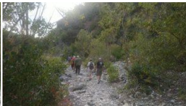
letto del fiume in secca