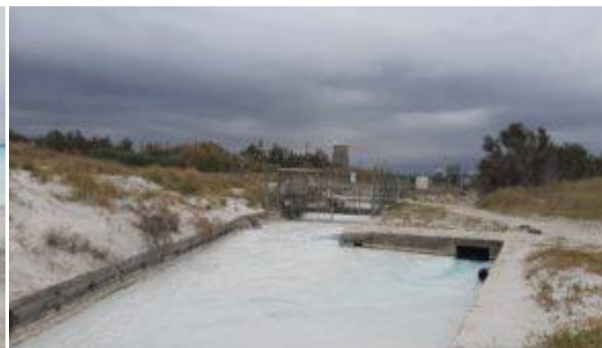
Lo stabilimento Solvay a ridosso delle spiagge bianche

GIAN Sez. Gran Pino - Via Guerrazzi, 110 - 57023 Cecina (LI)