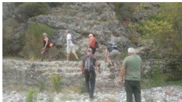
escursione a masso delle fanciulle

Il fiume ha un carattere torrentizio e questo lo rende soggetto a scarsità d'acqua nei periodi di siccità; Tuttavia il tratto iniziale dei suoi 73 chilometri offre la possibilità di effettuare piacevoli escursioni nell'entroterra toscano dove, anche durante la siccità, si possono trovare delle piscine di roccia per un bagno rigenerante e rinfrescante.